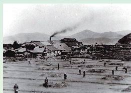
明治ごろの青崎風景(塩田)

下の写真のように、近代化で工業のまちへ姿を変えていきましたが、少しまちに足を踏み入ると懐かしい昔の姿を発見することができます。