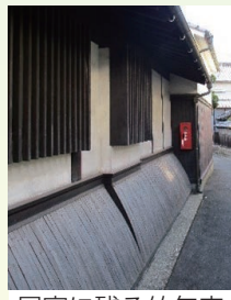
民家に残る竹矢来