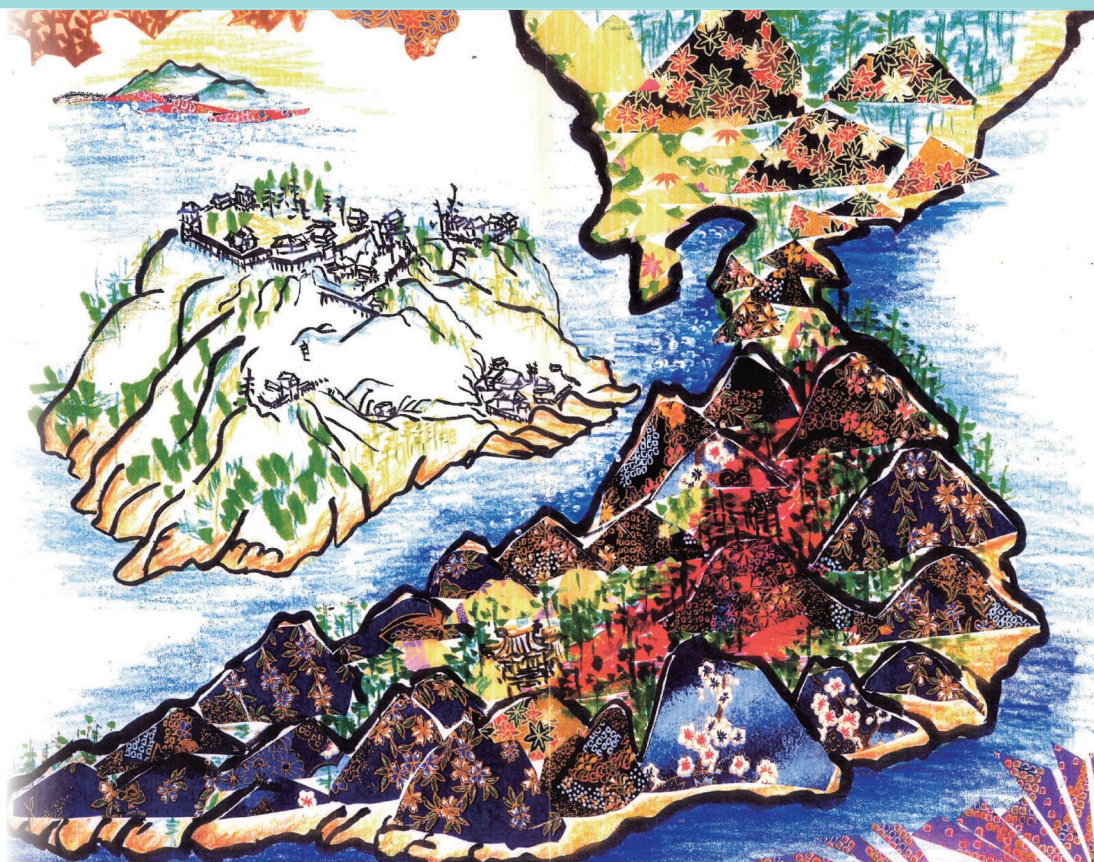
マップ表紙に使用されている向洋半島(右)と仁保島(左)の絵