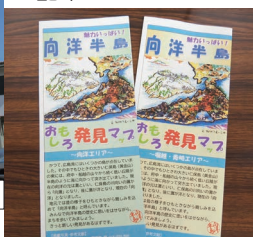
2種類の地区のマップ