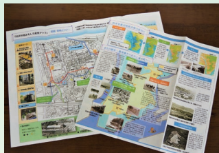
半島の変遷も紹介されています

マップには、まちの見どころが所狭しと掲載されており、公民館のイベントをはじめ地域の歴史学習の場で活用されてきました。その後、平成23年の改訂を経て、今年3月に再改訂されました。